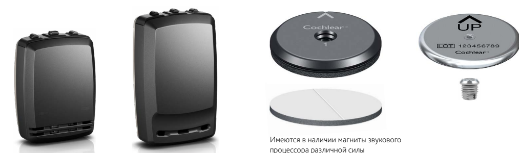
Имеются в наличии магниты звукового процессора различной силы