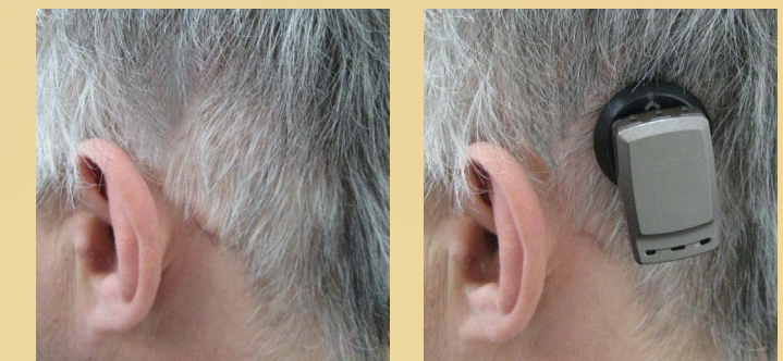
Через 4 недели после операции

Звуковой процессор легко надевается и снимается, в нем установлены программы для усовершенствованной обработки звукового сигнала, что позволяет автоматически приспосабливаться к вашим звуковым окружениям. Специально разработанная прокладка для магнита Baha SoftWear™ Pad комфортно адаптируется к форме вашей головы, равномерно распределяя давление для достижения наивысшего уровня комфортности ношения.